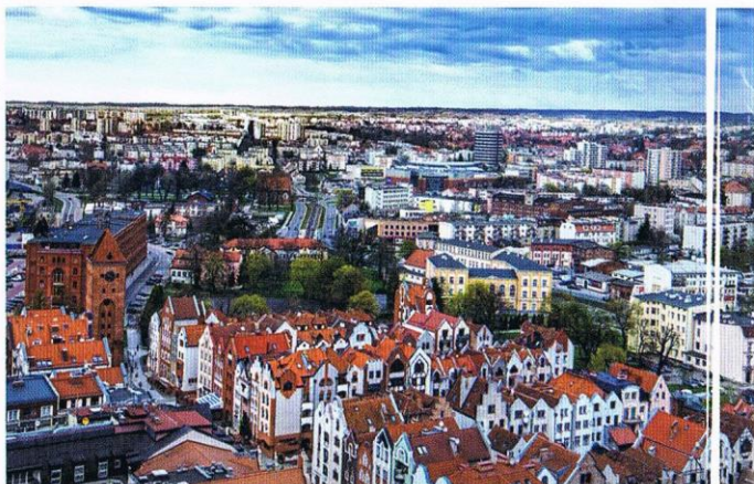
WIDOK NA ELBLĄSKĄ STARÓWKĘ Z KATEDRY ŚW. MIKOŁAJA

Nowe kamienice powstają na obrysach fundamentów dawnych kamienic i nawiązują do ich kształtów. Nowe-stare kamienice przywracają klimat starówki i tworzą piękne tło dla ocalałych i wspaniale odrestaurowanych zabytków architektury.