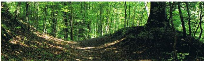
PARK LEŚNY BAŻANTARNIA

BAŻANTARNIA to piękny kompleks leśny, obejmujący obszar prawie 400 ha, przez wielu nazywana jest "małymi Bieszczadami". Obszar obfituje w liczne wzniesienia i doliny, w których to płynące strumienie oraz potoki tworzą tajemniczy i zarazem malowniczy krajobraz. Górskie cechy tego terenu, zbocza pokryte pięknym bukowo-grabowym lasem, unikalny świat flory i fauny - wszystko to sprawia, że Bażantarnia jest ulubionym miejscem odpoczynku i rekreacji nie tylko elblążan. Wytyczone szlaki zachęcają zarówno do pieszych wędrówek, nordic walking, joggingu, jak również do uprawiania turystyki rowerowej. Warto podkreślić, że przez Bażantarnię przebiega popularny szlak Green Velo. Przez Bażantarnię i dalej przez miasto przebiega także czerwony Szlak Kopernikowski, łączący miejsca związane z wybitnym astronomem.