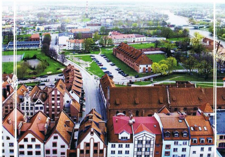
WIDOK Z KATEDRY NA ŚCIEŻKĘ KOŚCIELNĄ ORAZ MUZEUM ARCHEOLOGICZNO-HISTORYCZNE